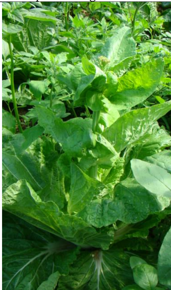
Les choux chinois qui montent en fleur au lieu de « pommer »