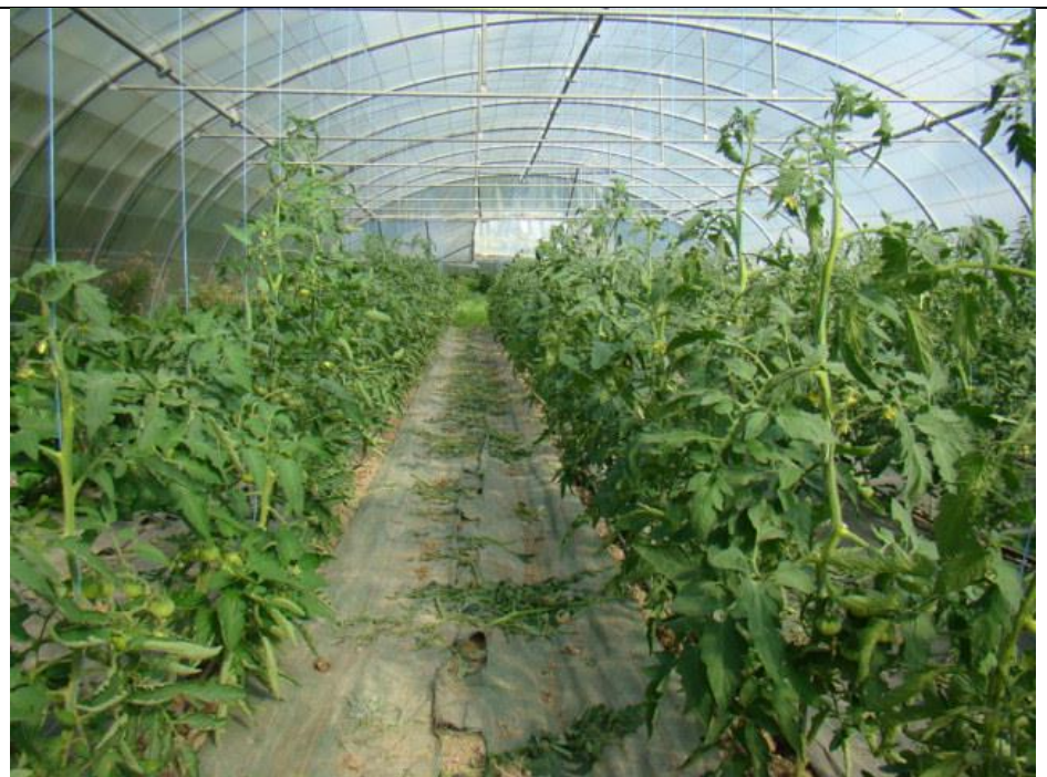
De beaux tunnels de tomates