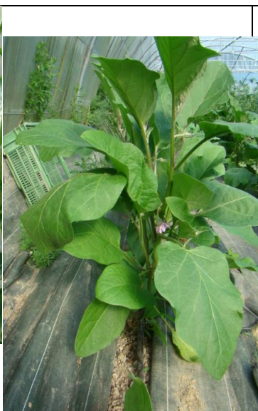
Aubergine en pleine croissance