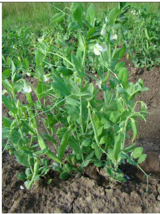
Pois gourmands OK

Des nouvelles du champ : d'abord les bonnes :