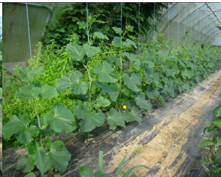
Plants de concombres qui s'épanouissent