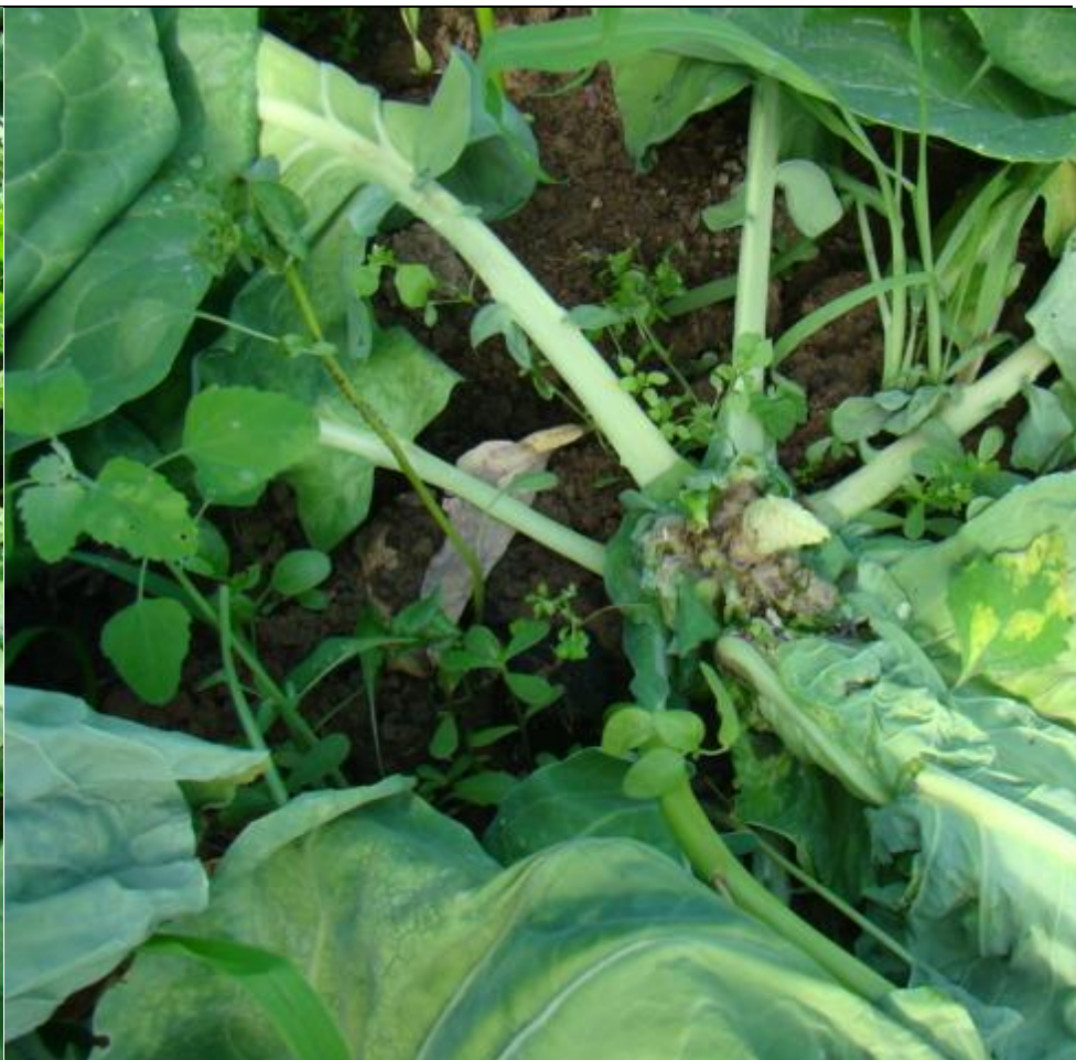
Certains choux qui pourrissent du coeur

Bon, à part ça dans l'ensemble les parcelles sont jolies, et on a décidé de faire fi du dicton de la saint Médar ! (vu qu'il a plu à St Médar et à St Barnabé...)