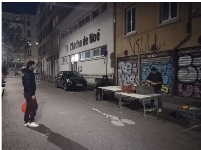
Livraison d'AMAPopote Lyonnaise devant le local habituel, à Lyon

La plupart des AMAP bénéficient de salles prêtées dans des MJC, foyers, gymnases, écoles... qui ont soudainement fermé. Des solutions dans l'urgence ont été trouvées !