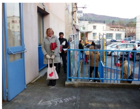
Organisation de l'AMAP du Creux, à St Chamond (42)

« Depuis la semaine dernière, nous avons mis en place une "amap'drive"» (Amapienne de Mines de Liens, Chessy, Rhône)