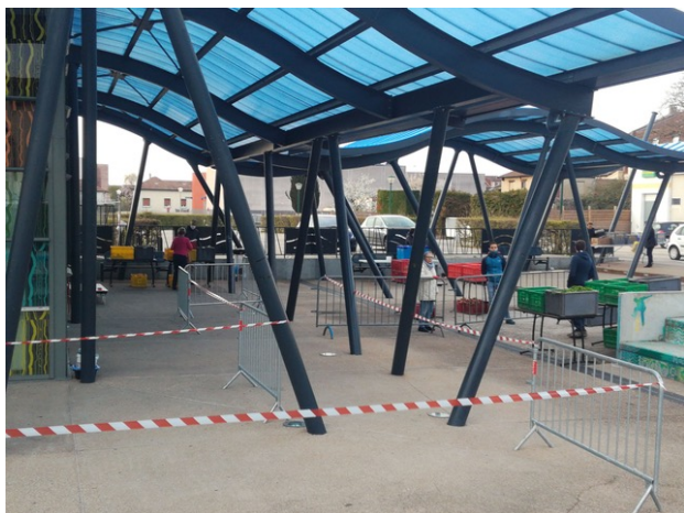
Organisation d'AMAP'Hort, à Ambérieu en Bugey (01)

« Les paysans ont préparé les commandes pour que la distribution soit rapide et sans manipulation » (Amapien des Pieds sur Terre , Lyon)