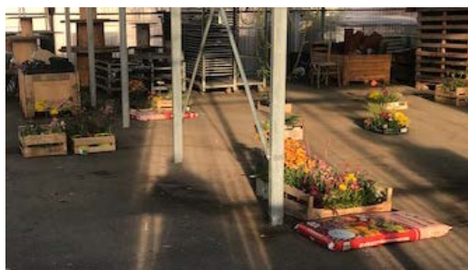
Cagettes horticoles de l'AMAP de l'Ozon, La Talaudière, Loire.