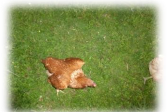
Cette année, la prairie est magnifique, énormément de plants différents, des fleurs sauvages qui embaument, quand même quelques fruits, avec la chaleur et les orages, les poules se cachent avec bonheur sous la végétation.