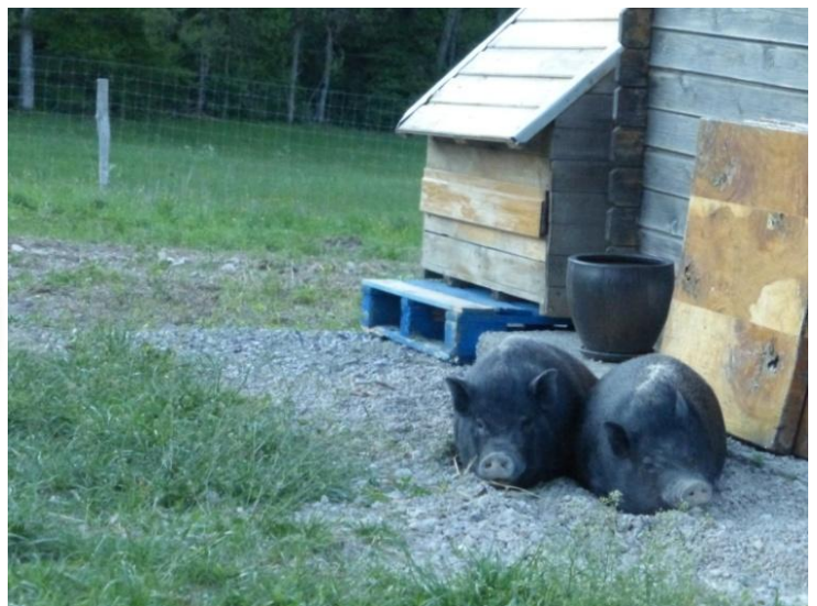
Moumoune et Félicie toujours aussi belles prennent un peu de repos, elles n'ont quasi pas grossies..., en bas, une pouppoule qui voudrait bien une caresse :)