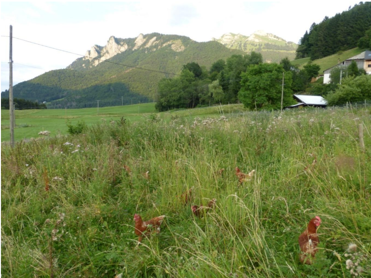
Magnifique vue sur le Mont Billiat (1894m).

Coquelicot, marguerite, reine des prés, sauterelle, vers de terre, papillon, abeille, coccinelle...cette année, la prairie est extrêmement riche de flore et de faune et ce n'est pas les poupoles qui s'en plaindront.