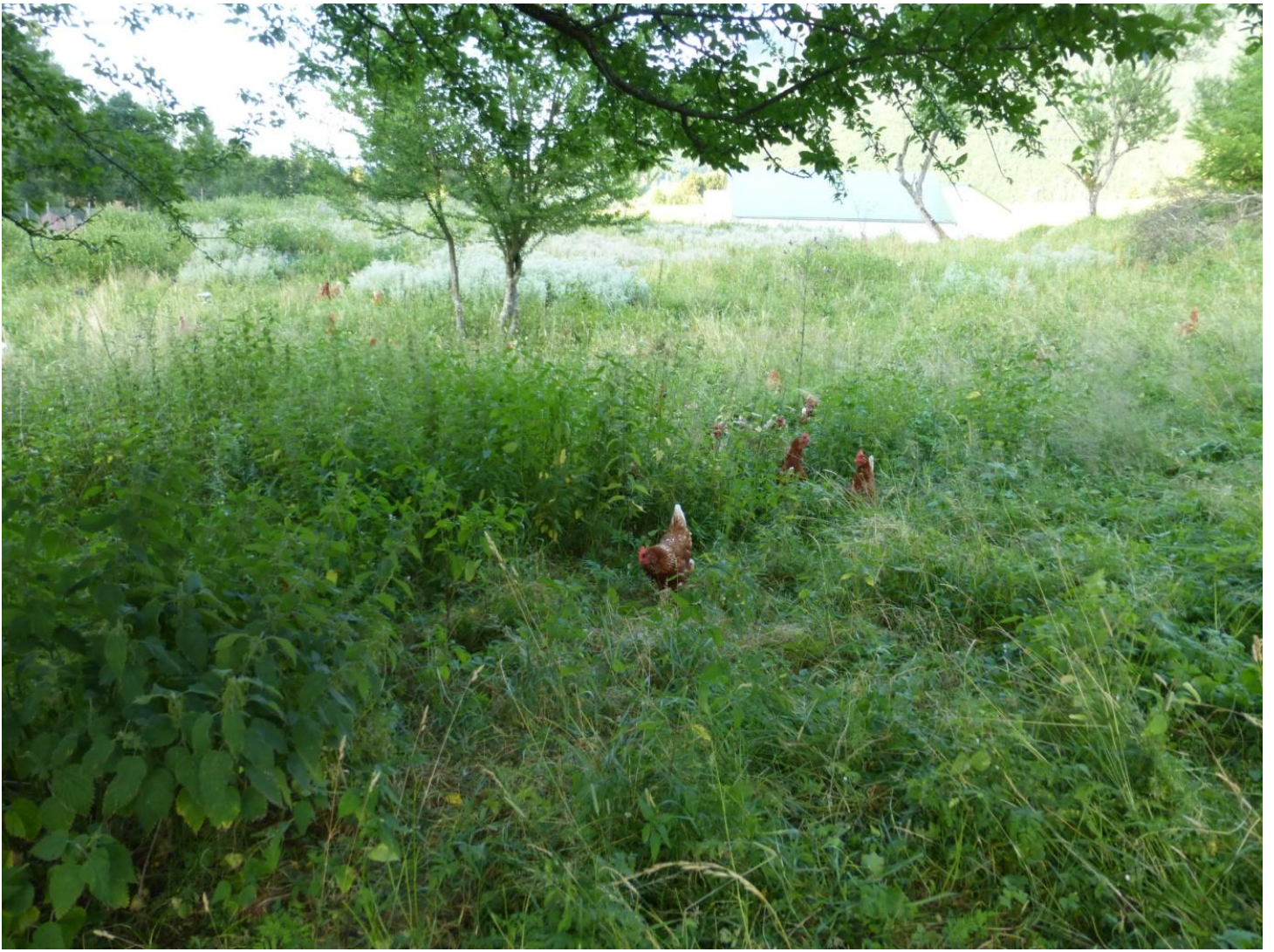
Avec les grosses chaleurs, mes pouppoules rentrent de plus en plus tard et profitent de leur parcours jusqu'à la nuit tombée.